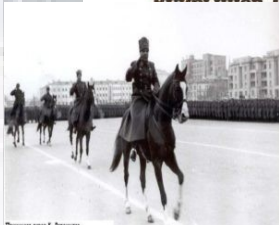
Парад парад К. Ворошилов

трибуну и произносит традиционную В конце её раздаётся сорок залпов. Под звуки фанфар парад. Первым вступает на начальствующего состава.