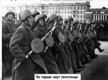
На параде идут пехотинцы

7-го ноября 1941-го года в городе командовал генерал-60-й резервной армией. Утро в главной площади Куйбышева 7 на площадь выезжает маршал коне следует Пуркаев и отдаёт Ворошилову с 24-й годовщиной Великой несётся долго не руководители партии и Шверник, Вознесенский, руководители. Среди гостей-миссия во главе с генерал-корреспонденты.