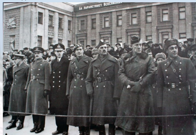
Военные атташе иностранных государств на параде 7 ноября 1941 года в городе Куйбышеве.

С неизвестными, но очень тяжёлыми потерями и последствиями.