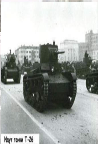
Идут танки Т-26

Парад до самого последнего момента был под вопросом из-за массированных бомбардировок столицы, резко участвовавших с началом наступления наземных немецких войск. Синоптики не могли дать точного прогноза на 7 ноября — все метеорологические станции на западе страны были захвачены врагом. Ночь накануне парада была ясной и звездной. Ни один германский самолет не рискнул взлететь в такую погоду.