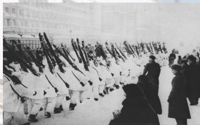
Подразделение советских лыжников отправляется на фронт по одной из московских улиц после парада на Красной площади 7 ноября 1941 года Выносной пост противовоздушной обороны на крыше гостиницы «Москва»