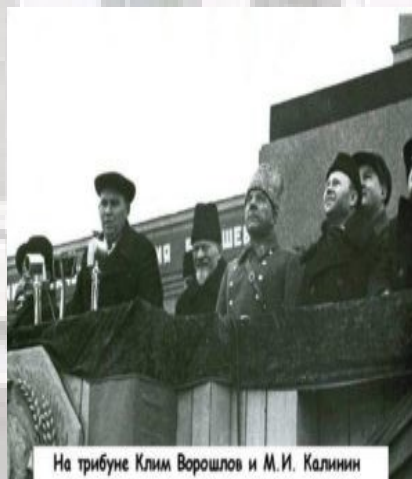
На трибуне Климент Ворошилов и М.И. Калинин