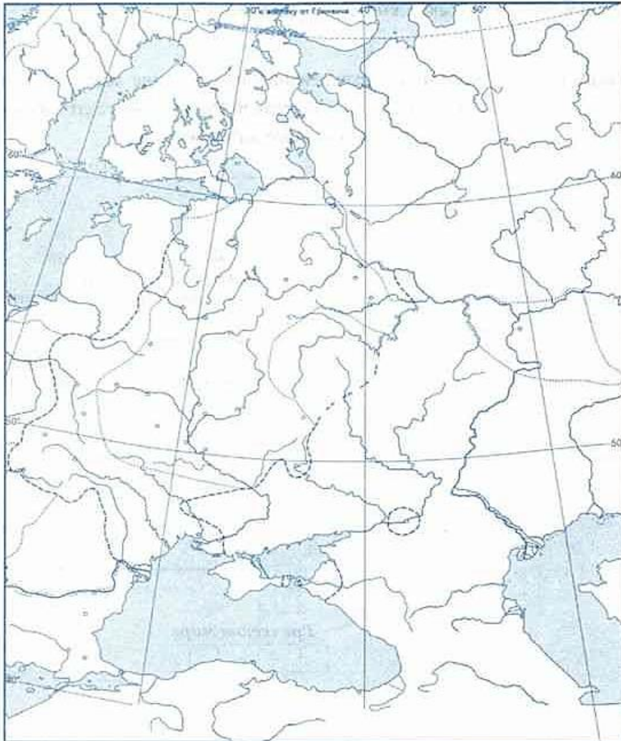
Древнерусское государство в IX–XI вв.